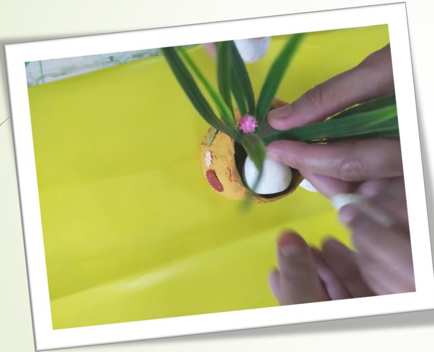
➤ Memasukkan batu Hiasan