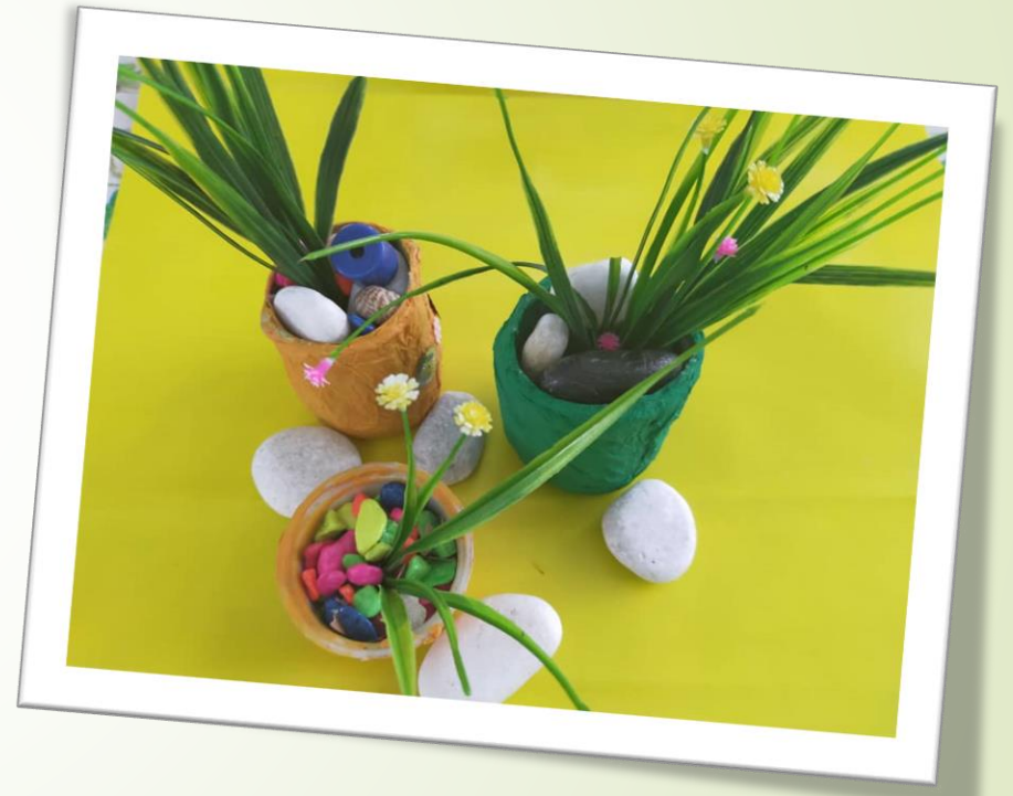
➤ Hasil Kerja